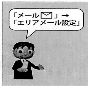
① エリアメール設定を選択