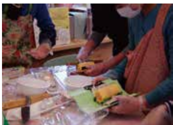
(写真右) 巻き寿司教室の風景

11月19日、飾り巻き寿司教室は沼津より講師の先生をお招きし、定員15名のところ、14名様に参加していただきました。教室の内容は①「バラ」の飾り巻き寿司教室②講師の先生おすすめめの紅茶+バラジャムを楽しまつ参加者交流でした。難しいと思つて挑戦した飾り巻き寿司も先生の説明通りに進めればあつという間に、きれいに完成して楽しい、食べて美味しいの三拍子で、参加いただいた皆様には終始楽しんでいただけたことと思います。次回開催が決定しましたので裏面ダイロクキッチンイベント案内をご覧ください。