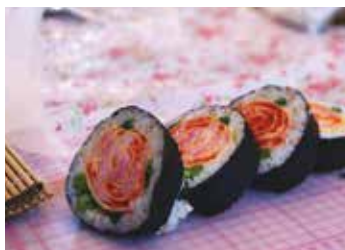
(写真左) 「バラ」の飾り巻き寿司