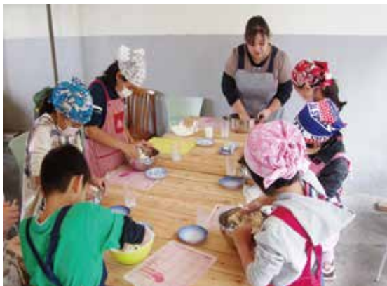
(写真) パン生地をこねる子どもたち

11月27日、こどもつちを対象としたパン作りの体験教室を開催しました。地元の小学生達が参加し、パン好きの先生に小麦粉をこねる最初の行程から丁寧に教えてもらいました。パンを発酵させる待ち時間には、ピザを作って食べ、プレゼント用のメッセージカードの作成もしました。参加してくれたみんなが大切にパンを持って帰っていく姿は微笑ましかったです。ご家族の皆様にも作ったパンを楽しんでいただけたことと思います。みんなで楽しめるパン作り体験教室。次回開催のご案内をお楽しみにお待ち下さい！