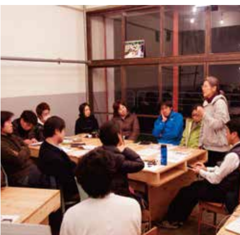
(写真) 意見交換の風景

最近では東伊豆町内のみならず、町外からダイロクキッチンを見学される方や実際に使用してくださる方が増えていきます。ダイロクキッチンのような場所を貸し出すコミュニティスペースが周辺にあまり無いようでの興味を持っていてくださる方がいるようです。といっても、まだまだ使用予定がない日が目立ちます。もっとダイロクキッチンを認知してもらえよう、イベントの数を増やし、一緒に場所の活用方法を考えてくれる仲間を探していこうと思います。イベントスペースとしての利用はもちろんです。また、雛のつるし飾りまつり期間中には稲取の町を盛り上げられるよう、町の人たちと一緒に賑やかしく企画を複数構想中です。次号にはそのイベント告知ができると思うので楽しみにお待ちください。