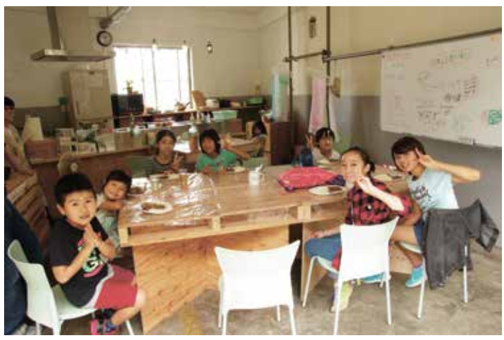
(写真) カレーが完成し、みんなで集合写真

ふるさと学級で知り合った、地元の小学生達がダイロクキッチンに遊びに来てくれました。当日は休日だったため、午前中からカレー作りをしました。みんなで作業分担して、高学年が低学年をフォローする形でみんなで協力し、おいしいカレーが出来上がりました。子どもたちはみんな元気で礼儀正しく、簡易皿を近くの店舗に買いに行つたところお店の方が皿をサービスしてくれるというワンシーンもありました。後日ここで宿題をやりに来る子どもたちも現れ始めました。現在、子どもたち向けの企画の計画を始めたいです。