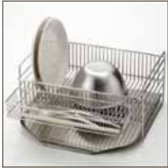
○金属製水切りボックス

現在、地域おこし協力隊の日常生活やダイロクキッチンでの活動において、以下の物品の寄付を募っています。 「物干し竿+物干し台」「ワゴン」「包丁スタンド」「金属製水切りカゴ」の4点です。 左側写真はあくまでイメージですので、まず心当たりのある方はお気軽にご連絡ください。ご連絡は左側に記載の地域おこし協力隊荒武の連絡先へよろしくお願ひします。