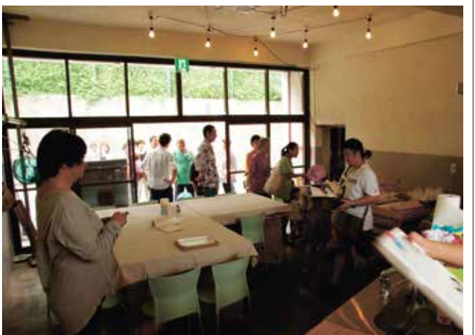
(写真) ダイロクキッチンに初めて行列ができた瞬間