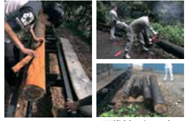
間伐材の切り出し

先日、地元の方から間伐材を頂く機会がありました。その間伐材を役場の方に協力してもらい製材所まで運びこれから加工していきます。東海汽船の事務所前には古くなってしまった木製のベンチがあり、今回はそれを新しくするためにこの間伐材を使ってベンチを作成します。ベンチも一から自分たちで設計します。多くのの人に使用して頂けるベンチになるよう一所懸命に作成しています。