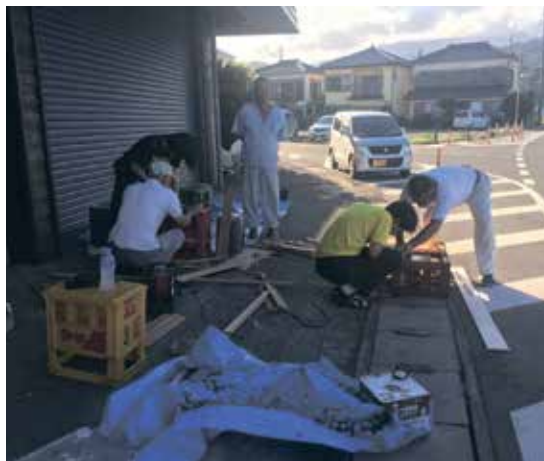
地元の方々と一緒に木箱を切り出している所

まだまだ慣れない事ばかりですが地元の方々が作業中に声をかけてくださったりと稲取の暖かさを日々感じるとともに、精一杯力を注いで完成を目指したいと思っています。皆さんよろしく願います。