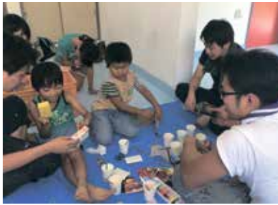
フォトブロックを作る子供達

8月9日にひがしいず日和写真部と静岡県立稲取高等学校ボランティア部の方々とワークショップを開催しました。集まって頂いた地元の子供達と思いの写真を使ったフォトブックを作成し、また東海汽船事務所のシャツターを海をイメージした青色に塗装してもらいました。子供達の作品はどれも個性溢れるもので素晴らしいものでした。子供たちには初めての体験であるシャツターの塗装もとても綺麗に仕上がりました。事務所の雰囲気もまた一つ新しい姿へと変貌しました。