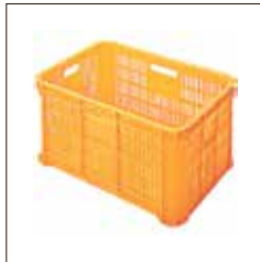
○コンテナボックス