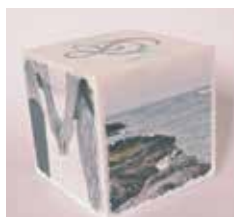
フォトブロックイメージ