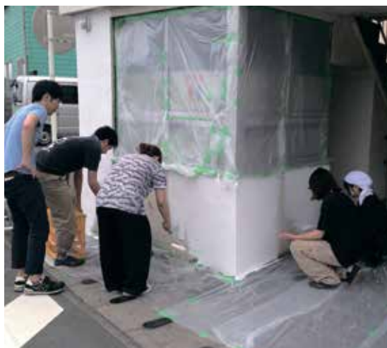
東海汽船事務所の外壁を塗装する様子

のみの待合室でしたが、来年1月には稲取の歴史にまつわる展示室と一体化した待合室となるように改修をしています。現在は建物周辺の草むしりや、外壁の塗装などを行ってまいります。8月4日から長期的に稲取を訪れて施工を行う予定です。ぜひお声をかけください！