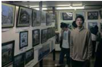
稲取灯台の刺繍の絵画を見学