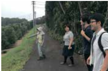
伊豆農業研究センターを見学