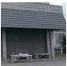
塗装するシャッター

現在のシャッターは、潮風によつて錆びてしまっています。海をイメージした青色にシャッターを塗り直す作業をお手伝いいたしませんか！