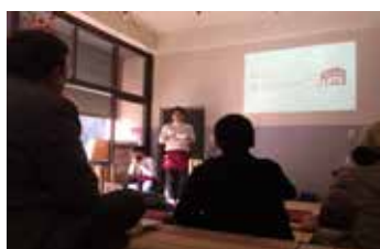
ダイロク劇場_映画上映+昔映像

手の多様さを実証するためのイベントも兼ねていた今回は、地場産品・稲取高校の被服・食物部の皆さんによるケーキ等の販売を行ったダイロク市場。施設に設置したプロジェクターを用いて、スポーツ観戦と飲食を楽しむダイロクBAR。地元のかき菜を用いた雑煮を、通りを歩く人達対して振る舞ったダイロク食堂。東伊豆町近辺がロケ地となった映画や昭和40年代の稲取の子供の遊びを収録した映像の上映を行ったダイロク劇場。以上の4本立てでイベントを行いました。改修した建物が様々な方たちに喜んで活用していただく、ダイロクキッチンの片鱗をみることできたイベントとなりました。