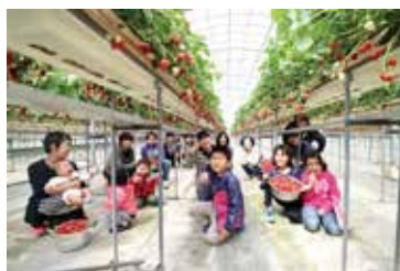
イチゴ狩り_参加者で集合写真

4月24日、町の方を対象としたイチゴ狩り&ジャム作りの体験イベントを実施しました。イチゴ狩りシーズンは終了しお客さんが立ち入らなくなったイチゴハウスでは食べごろの美味しいイチゴがまだまだ沢山あり、もったいない状態になってしまっていることを知って欲しく、イベント企画に至りました。イベントではダイロクキッチンと接点のなかった多くの方にお越しいただき、少しだけ地元の方たちにとつてダイロクキッチンが身近な場所になったかな?と思います。今回の反省を次回へ活かす。様々な方に親しんでダイロクキッチンを使っていただくようお願いいたします。