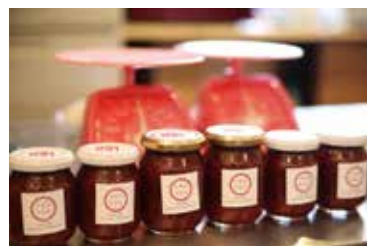
完成したダイロクイチゴジャム