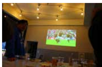
ダイロクBAR_スポーツ観戦