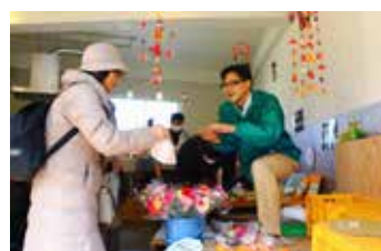
ダイロク市場_地場産品販売