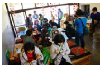
ダイロク食堂_雑煮+休憩所