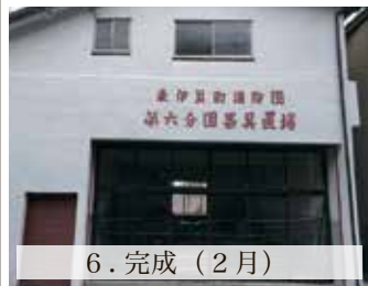
6. 完成 (2月)