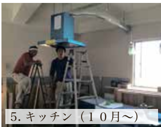
5. キッチン (10月~)