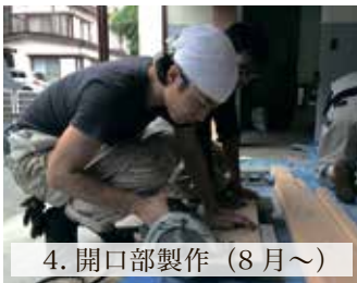
4. 開口部製作 (8月~)

誰でも気軽に立ち寄れるので是非一度生まれ変わったダイロクキッチンにぜひお越しください!!