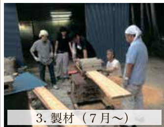
3. 製材 (7月~)