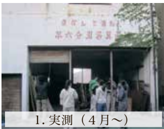
1. 実測 (4月~)