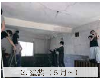
2. 塗装 (5月~)