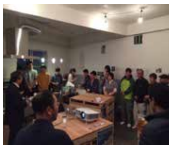
11/14のプレイベントの様子

ダイロクキッチンの2月のオープンイベントに向けて、今までお世話になった方々を招待して、11月14日にプレイベントを行いました。学生がお礼として自分の出身地の地元料理を持ち、地元の方々に振る舞いました。