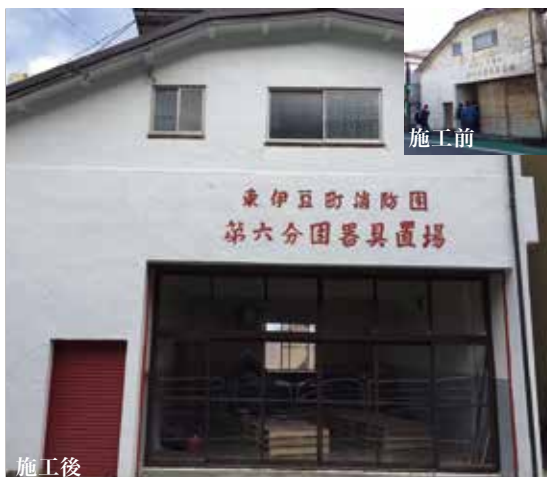
歩道から見たダイロクキッチン

修プロジェクトは今年の4月から旧第六分団の改修を行っています。11月の段階でほとんどの施工を終えて、キッチンとして清潔感のある建物に生まれ変わりました。今後はダイロクキッチンで様々なイベントを行っていきたくと思っています。これからよろしくお願いいたします。