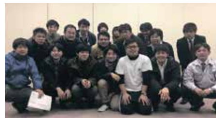
■ご協力頂いた推進協議会の方々

本イベントの前日には空き家利活用推進協議会にて最終打ち合わせを行い、当日の流れやクイズの進め方などを確認しました。当日は推進協議会の方々にも協力を頂き、スムーズに進めることが出来ました。多くの方と一緒にイベントを進められたことを嬉しく思います。たくさんのご支援、ありがとうございました！