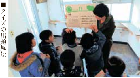
■クイズの出題風景

昨年四月から改修を始めたこの建物や、自分たちの活動をより多くの方に知ってもらいたいとの思いから企画したこのイベントには、八七人の方に参加して頂き、開催の目的を果たすとともに、成功に終えることが出来ました。ご参加下さった方々、本当にありがとうございました！