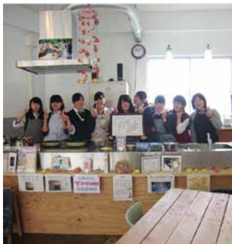
写真：稲取高校被服・食物部の皆さん

高校生自らが売り手となってお客さんと直接コミュニケーションを取り、その場で自分たちの料理に関する反応を得ることができるとは今までになかったそうです。今回の「あつたかふえ」を振り返るとダイロクキッチンという場所が、授業や部活動で勉強していることの実践の場として、また活動を通して高校生と地元の人達が交流する場としての役割も担えるということが発見できました。今回の発見や反省を活かして今後は「あつたかふえ」のように、高校生の実践の場や地元内の交流の場が提供できるような企画も展開していきたいと考えています。被服・食物部とのコラボイベントも定期的開催しますのでチェックよろしくお願いたします。