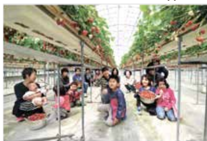
写真：昨年イベント参加者の皆さん