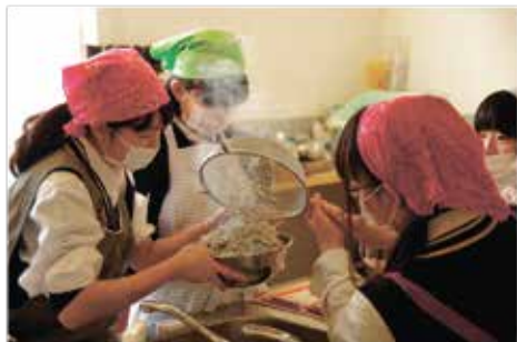
写真：稲取しらすを調理する部員たち

2月に稲取高校、被服・食物部の皆さんとダイロクキッチンとの連携イベント「あつたかふえ」を開催しました。被服・食物部は伊豆産の食材を使った料理を研究しており、ダイロクキッチンをそんな皆さんの活動披露の場として活用してもらったことが今回の企画の目的でした。イベントの内容は主に高校生の作った料理の販売です。特に稲取産のしらすを使った「稲取しらす Pizzai」は今回の目玉商品で、多くのご来場いただいた方々に食べてもらおうことができました。できるだけ当日の来場者を集めるため、新聞記者の方やテレビ報道の方などを対象とした試作・試食会の開催やSNSを用いた広報活動を積極的に行いました。おかげさまで当日は地元のお客さんにも多くご来場いただきました。