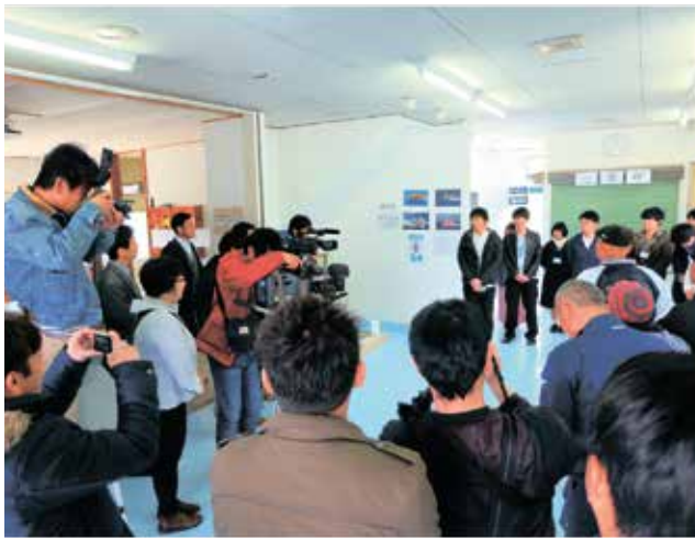
■イベント当日の開会式の様子

昨年四月から改修を始めたこの建物や、自分たちの活動をより多くの方に知ってもらいたいとの思いから企画したこのイベントには、八七人の方に参加して頂き、開催の目的を果たすとともに、成功に終えることが出来ました。ご参加下さった方々、本当にありがとうございました！