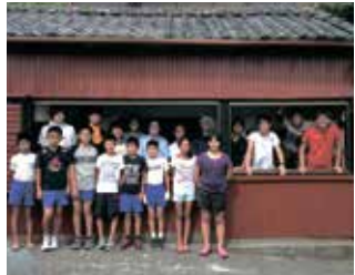
昨年改修した『水下いこいの家』

空き家改修プロジェクトは昨年8月に水下いこいの家を改修しました。やる事全てが初めての経験で、学校では決して学べないもの。改修を通じて、自分たちが考えたものを創る事の難しさを実感。しかし何かをやるうと思う事、またそれを実践する事も重要であると認識しました。この活動をきっかけに旧第六分団の改修に加え、徳島、相模原への活動地域を拡大につながり、現在では三つの地域で活動しています。他大学にも輪が広がり総勢33名で、私たちはこれからも継続的に東伊豆町で活動を行います。活動を町の方々に知ってもらいたいと思ひ、定期的に新聞を発行します。これからはより詳しくお願ひします。