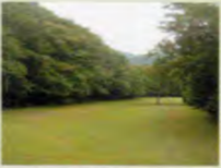
クロスカントリーコース