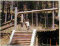
アスレチック広場