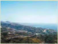
★あづまやからの眺望