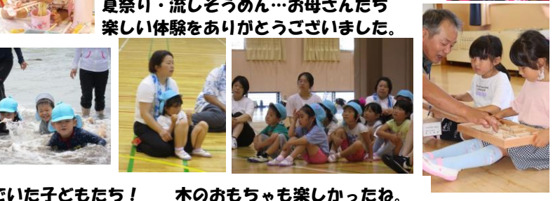
夏祭り・流しそうめん…お母さんたち楽しい体験をありがとうございました。