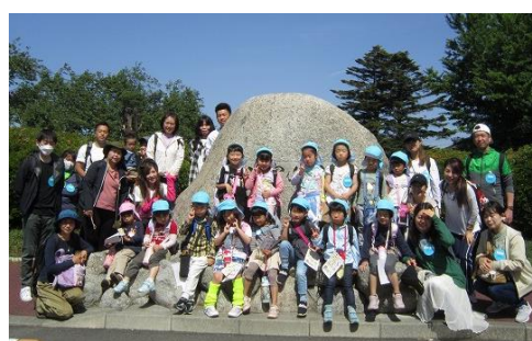
親子遠足…天気が良くて気持ちよかったね