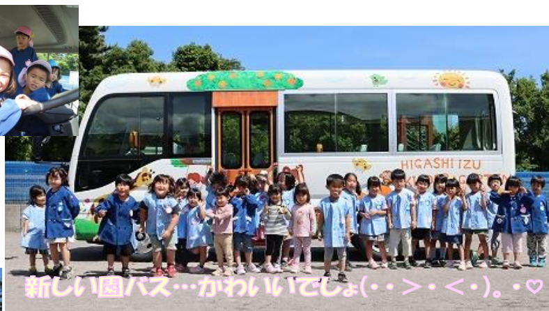
新しい園バス…かわいいでしょ(・>・<)。..♡