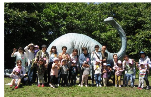
4月から始まった給食おかわりする子も…