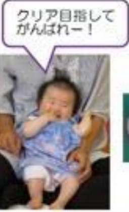
クリア目指して がんばれー!