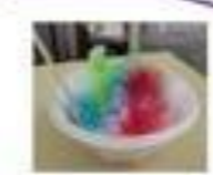
おみこしだよ! わっしょい ビッピッ!