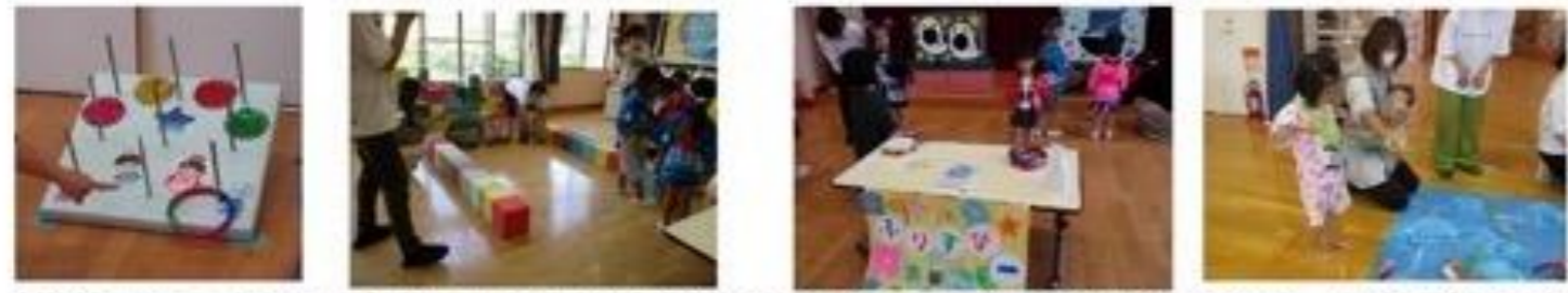
輪投げ・ゴルフ・フリスビー・魚釣り、4つのゲームに挑戦しました!クリアすると、ちょうちんメダルの裏にシールを貼ってもらえます!

水遊びを始めてから、保護者の方から「まだおむつが取れていなくても、プールに入れますか?」「虫よけスプレーや日焼け止めを塗っているの、水を汚してしまうのではないかと心配です」「冷たい水のプールですか?」というお話がありました。ご安心ください☆ひよこの会では、衛生面に配慮し、1人ずつベビーバスを用意して、少し温かい水を溜めて遊んでいます。他にも疑問に思ったことがありましたら、お知らせください。