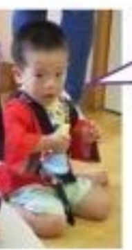
輪投げが入ったら、 ベルを鳴らす お手伝い♪