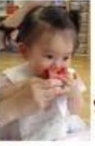
おやつにスイカを食べまし た。大人が一口サイズに切っ ても、最後にはガツリ!この 食べ方が一番おいしいね♪