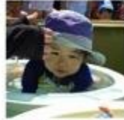
隣でプールに入っている年長 さんの真似をして、水に顔を つけている...つも!(笑)