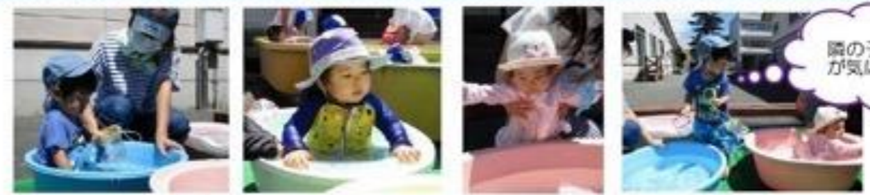
園の子の様子 が気になる...