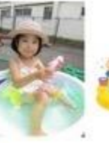
私はピンク色 のクラゲ!