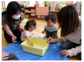
片栗粉は水を混ぜて「ダイラダンシー現象」を楽しみました♪片栗粉のキュッとした感触なのに、水を混ぜるとドロドロになったり、かたまったり…。触っている大人もおもしろくて、何度も触って楽しみました！