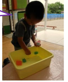
寒天は、粉寒天に水と食紅を混ぜたものを煮て冷やして作りました。冷蔵庫から出したばかりの寒天は、ひんやり冷たくてフワフワ♪手で握るとつぶれてポロポロと細くなるのが楽しくて、長い時間遊ぶ子が多かったです。