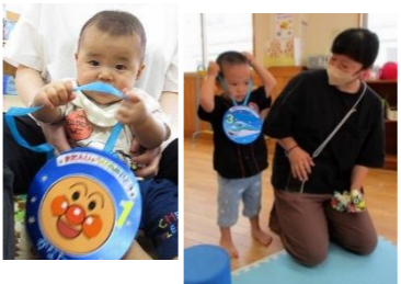
プレゼントはメダルです☆お家に飾ったり、写真を撮ったりしてくださいね！