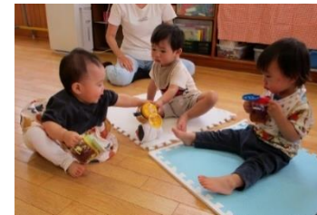
園庭に出ると、幼稚園のお兄さん・お姉さんたちが遊びの仲間に入れてくれることが多いです！嬉しいですね！！

何度も遊びに来てくれる子が増え、子どもも大人も顔見知りになってきたようです。友だちの仕草やおもちゃの遊び方を真似する子がでてきました。また、ひよこの会で遊んだことやみんなで歌った曲を言葉や身振りで伝える子も出てきたようです。お母さんだけでなく、お父さん・おばあちゃん・保育ママなど…お子さんに関係のある方ならいつでも大歓迎です♪みんなでたくさん遊びましょう！