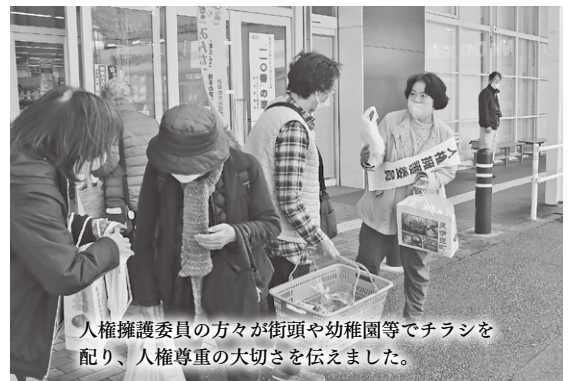
人権擁護委員の方々が街頭や幼稚園等でチラシを配り、人権尊重の大切さを伝えました。

いじめや性被害等の虐待、インターネット上の誹謗中傷、性的マイノリティ等に対する偏見や差別、職場でのハラスメントなど、多様な人権問題が存在しています。これらの人権問題を自分のこととして捉え、互いの人権を尊重し合うことの大切さについて考えてみませんか。