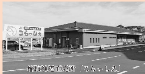
稲取漁港直売所「こらっしえ」