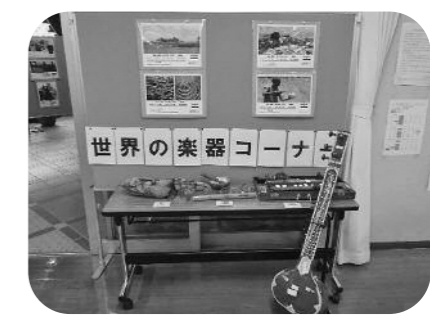
館内に世界の楽器を展示（昨年夏）

募集 《演奏のコラボをしてくださる大人の方》 歌、キーボード、ギターなど演奏できる方を募集しています。もちろん大勢のお客さまもお待ちしています！