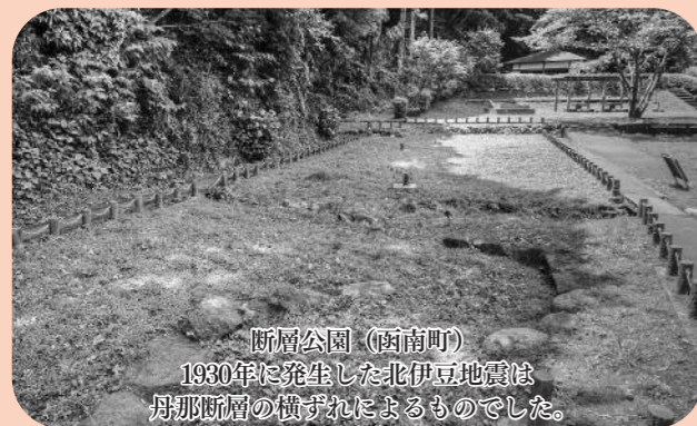
断層公園（函南町） 1930年に発生した北伊豆地震は 丹那断層の横ずれによるものでした。

A：北伊豆地震を引き起こした丹那断層はこれまでの研究の結果、平均して500年から1000年に1度動くことが分かっている。人間の一生と比べると、はるかに長い。大事なことは、「いつか大地震がくる」と恐れおののくのではなく、地震を科学的に冷静に受け止める姿勢。津波や水害でも過去にここまで到達したということがかなり詳しく分かっているし、そのときどうすればよいかと考えておくことだね。