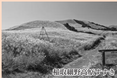
稲取細野高原すき

歳入総額は、28年度に比べて2億5,698万3千円(△4.7%)の減でした。町税は、入湯客数の減少やたばこ離れ、税負担の低い加熱式たばこの販売増などにより、2,563万1千円(△1.3%)の減少となりました。