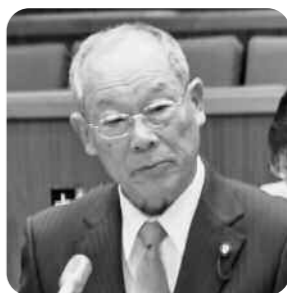
鈴木 勉 議員