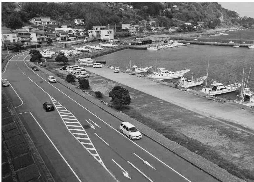
稲取漁港直売所の建設予定地

問 統合準備会PTA部会の中で廃止や継続等賛否両論であった。両校保護者懇談会において協定服の話も取り上げられたが、特に意見が無かったのでこれまで通り協定服を継続していく。 問 大川地区の新1年生へ貸与して他の地区の新1年生への対応は。 答 今回は統合に対しての特例と考えている。今後は児童減少も考え入学時に小中入学時に補助を検討していく。