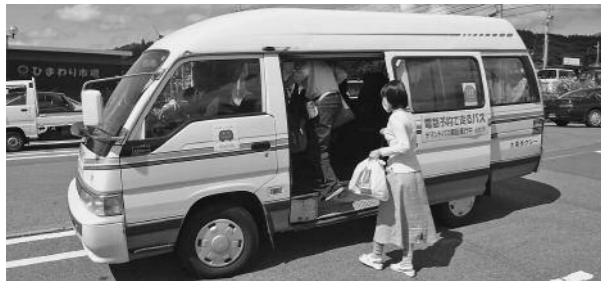
オンデマンド交通 (乗り合いタクシー) —東京大学オンデマンドプロジェクトHPより—

ので当町は該当しない。 問 社協が協力したり、シルバー人材センター事業の一環として、タクシーの半額程度の料金設定での有償ボランティア輸送事業がある。当町には該当しないが参考にしていただきたい。 町長 本年は広域で「交通網形成計画」を策定し、課題の解決に取り組む。