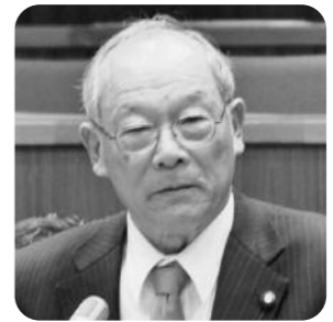
鈴木 勉 議員