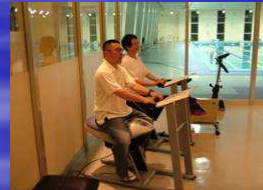
施設内に設置した健康機器