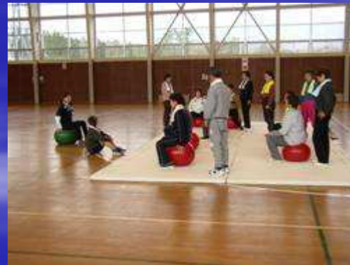
アリーナでの事業