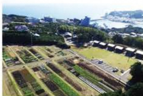
東伊豆町農林水産課