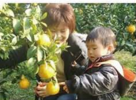
収穫体験農園 ふたつぼり