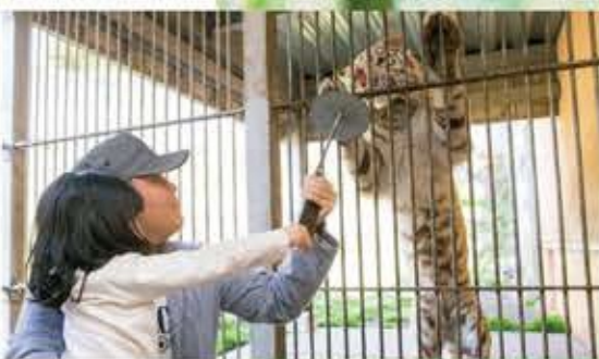
伊豆アニマルキングダム